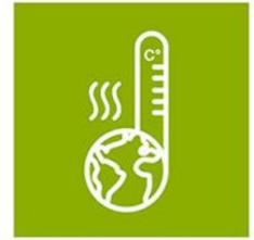
Adaptatie aan klimaatverandering