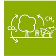
Koolstofopbouw en vermindering broeikasgassen