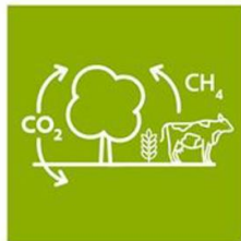
Koolstofopbouw en vermindering broeikasgassen