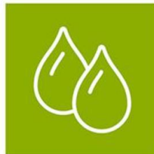
Zorg voor water