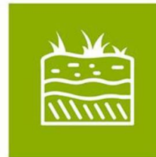
Zorg voor bodem