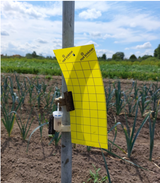
Figuur 4: Gele vangplaat met lokstof op preiperceel

Als planten aangevallen worden door herbivoren, produceren ze de vluchtige stof methylsalicylaat (MeSa) als verdedigingsmechanisme om predators te lokken. Deze lokstof is synthetisch beschikbaar en hebben we in een dispenser naast de gele plakval gehangen, zoals op Figuur 4 te zien.