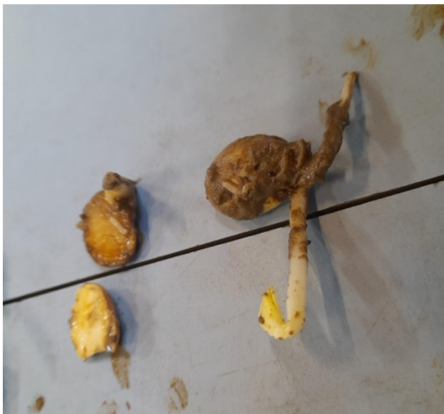
Figuur 3: Aangetaste bonenzaden door maden van de bonenvlieg (Beitem, 12 mei 2023)

Binnen de W&W werking hebben we deze test op een aantal percelen uitgevoerd. Op het proefbedrijf van Inagro deden we dit in mei 2023 op een perceel waar kikkererwten zouden gezaaid worden. Meer dan de helft van de zaden was aangetast: zie Figuur 3. In voorjaar 2023 was de druk van bonenvlieg algemeen hoog en waren er verschillende meldingen van schade.