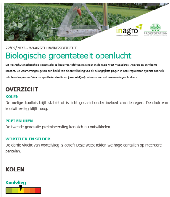
Figuur 1: Voorbeeld van een waarschuwingbericht in 2023

Tweewekelijks maken we een update op van de waarnemingen en stellen we beheersingsadviezen op die we samenvatten in een waarschuwingbericht. Deze berichten versturen we naar alle biotelers en adviseurs die zich gratis voor deze dienst inschreven. In 2022 en 2023 stuurden we respectievelijk 12 en 13 waarschuwingberichten naar 159 tot 239 ontvangers.