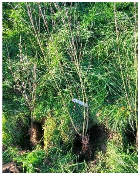
Afbeelding 1: Vanhee R., aanplant losse heg.

De aangeplante losse heg scheiden van vee door middel van een aantal rijen prikkeldraad tussen palen.