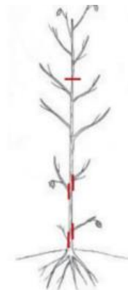
Afbeelding 2: RL Meetjesland, knotbomenbrochure, 2015.