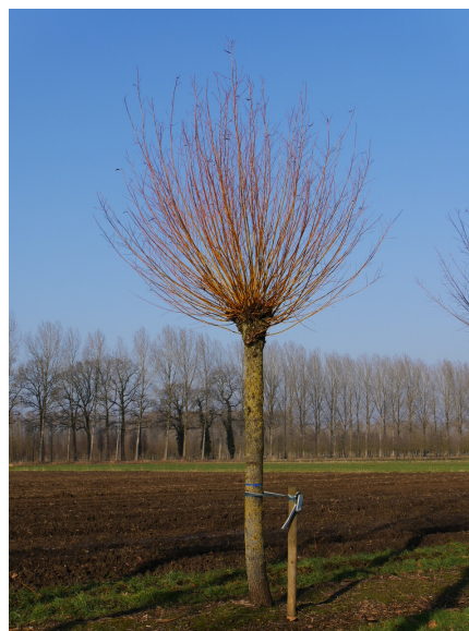
Afbeelding 6: Van Den Berk boomkwekerijen