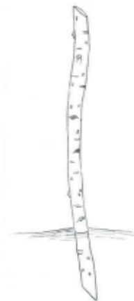
Afbeelding 4: RL Meetjesland, knotbomenbrochure, 2018.

Aangeplante boom scheiden van vee door middel van een beschermingskoker, dwarslatten of prikkeldraad.