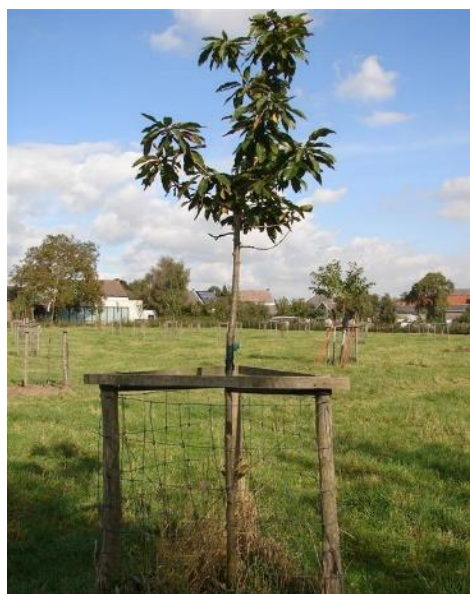
Afbeelding 2: fruitabc, inheems- en uitheems fruit, 2015.