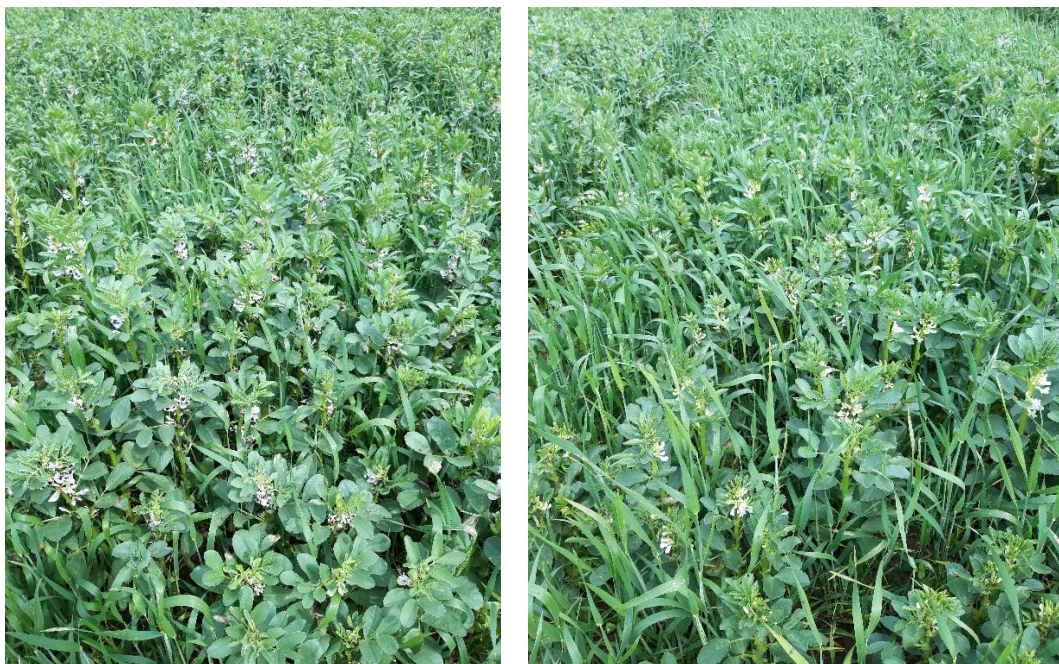
Figuur 2: Veldboonrassen Victus (links) en Banquise (rechts) in mengteelt met de zomertarwe Feeling op 11 juni 2019.

Gloria kwam niet goed op (gemiddeld 63%). Naar het einde toe van de teelt was de stand van dit ras bij de beste. Dit was het langste ras (gemiddeld 104,6 cm). Gloria bleek uiteindelijk ook het hoogste gemiddeld ruw-eiwitgehalte te hebben (30,9%). De opbrengst lag net iets boven het gemiddelde (2,3 ton ha -1 bonen).